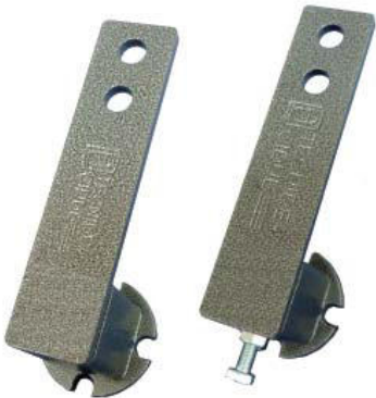
Spannelement Typ RE + REP