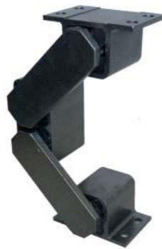
Schwingelement Typ DE