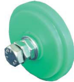
Radsatz Typ RO / XRO