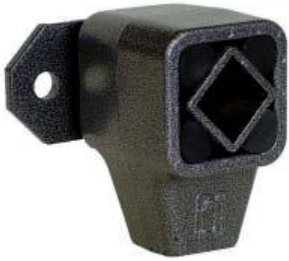
Schwingelement Typ BT-F