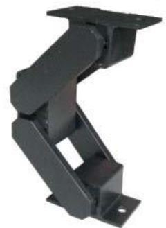
Schwingelement Typ DE-2L