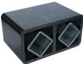
Gummifederelement Typ AD-T