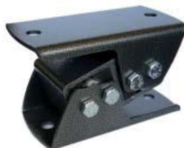
Schwingungsdämpfer Typ AN