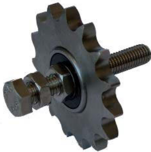
Kettenradsatz ZN / ZI / ZK