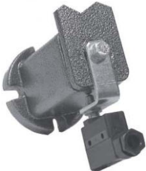
Spannelement Typ FM