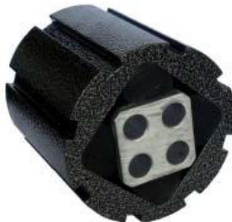
Gummifederelement Typ AC-P

An den Gummifederelementen darf nachträglich nicht geschweißt werden. Zur Befestigung der Außengehäuse bzw. zur Befestigung auf den Innenvierkantprofilen der Gummifederelemente bieten wir gesondert die zugehörigen Befestigungselemente an.