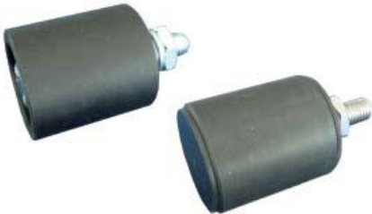
Spannelement Typ RP + XRP