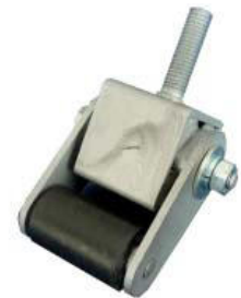
Drückerlement Typ PAR-T