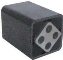
Gummifederelement Typ AR-P