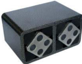
Gummifederelement Typ AD-P