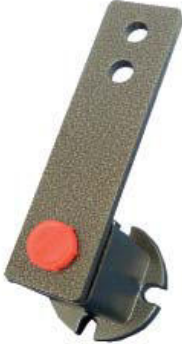
Spannelement Typ FE + FEP