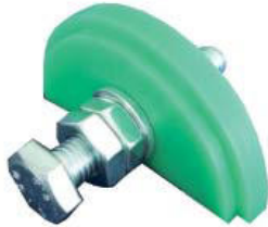
Gleitbacken Typ VR / XVR

Kettenradsätze gemäß Abbildungen in verschiedenen Ausführungen Typ XZN, Typ AZN, Typ ZN / ZI / ZK, Typ XZK