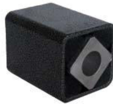
Gummifederelement Typ AR-F