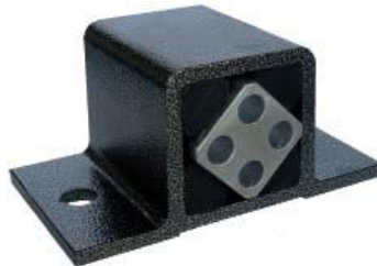
Gummifederelement Typ AS-P