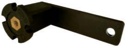
Spannelement Typ PX