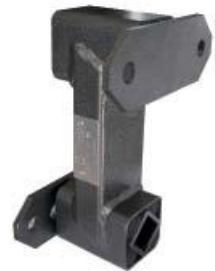
Gummifederelement Typ TP-SR