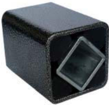
Gummifederelement Typ AR-T

Abmessungen und weitere technische Daten auf unseren Internetseiten oder auf Anfrage.