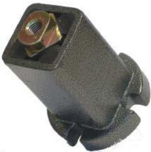
Spannelement Typ CEB + CEBP