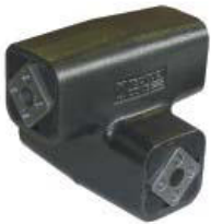
Kreuzgelenk Typ CR-P