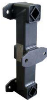
Schwinge Typ TD-SR