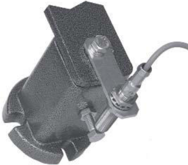
Spannelement Typ FPI