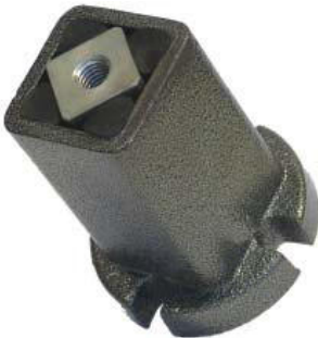
Spannelement Typ CEA + CEAP