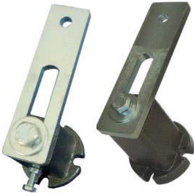
Spannelement Typ ME + MEP