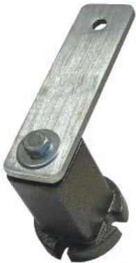
Spannelement Typ BE + BEP