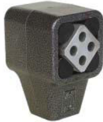
Schwingelement Typ TB