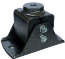
Schwingungsdämpfer Typ Y