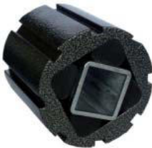
Gummifederelement Typ AC-T