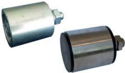
Spannrollen Typ RU + XRU