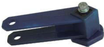
Spannelement Typ SN